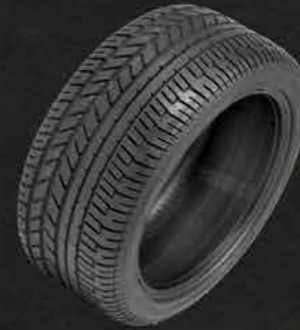
P Zero System