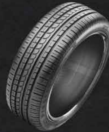
P Zero Rosso