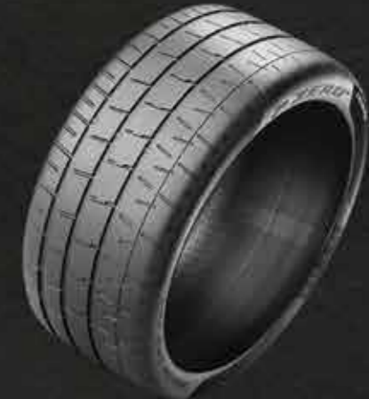
P Zero Trofeo R

Pirelli CINTURATO CN36 przez wiele lat była stosowana jako oryginalne wyposażenie Porsche - od lat 60-tych aż po lata 80-te. Jej współczesne wcielenie odwzorowuje charakterystyczny design, jednocześnie wykorzystując najnowsze technologie Pirelli, które służą uzyskaniu pełnego dopasowania i wysokich osiągnięć.